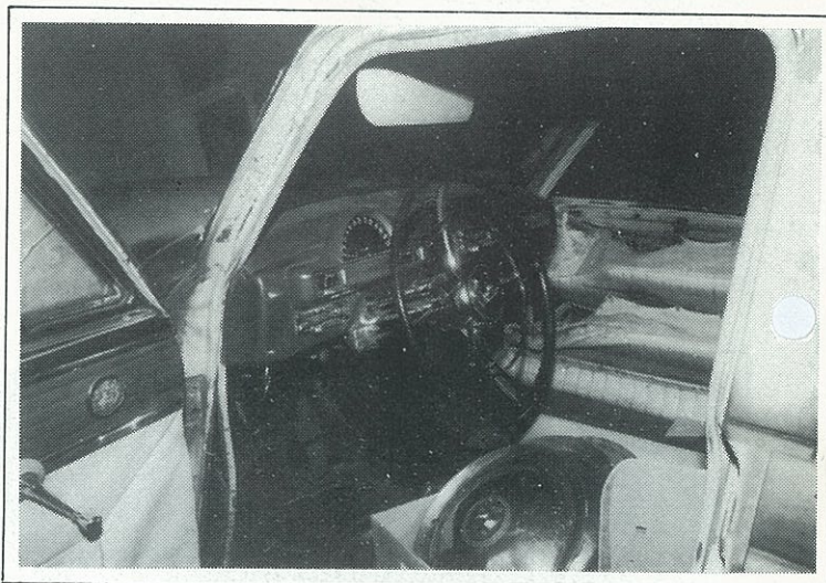
Mælaborðið er glæsilegt, heilmikið króm og ekki er stýrið síðra!

skipt um bæði frambrettin, sem voru farin að ryðga, og bíllinn búinn undir sprautun. Allt króm var tekið af honum, búið er að grunna og spársla að hluta, en síðan ekki söguna meir! Þannig lítur bíllinn enn út í dag, allt króm er fyrir hendi og mest af því í góðu ásigkomulagi, byrjað hefur verið á endurbótum á áklæði sem annars virðist vera í samilegasta standi. Mælaborðið og stýrið er sérlega glæsilegt, mikið krómað og skemmtilega útfært.